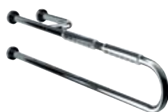
5785 262 85 Stütz-Griff, 850 mm Support bar