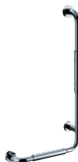
5770 262 60 Winkelgriff, links Angle grip, left