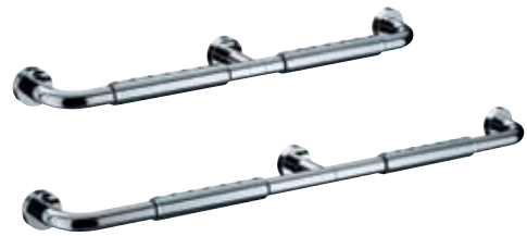
5770 262 40 Haltegriff, 425 mm Grip handle