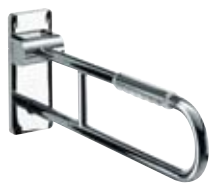
5785 262 82 Klapp-Stütz-Griff, 820 mm Hinged support bar