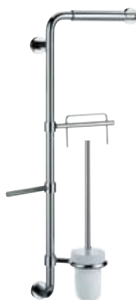
5780 001 01 WC-Line WC-Line