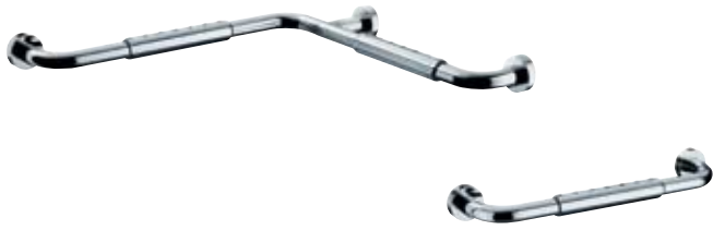
5770 262 50 Eckgriff Corner grip