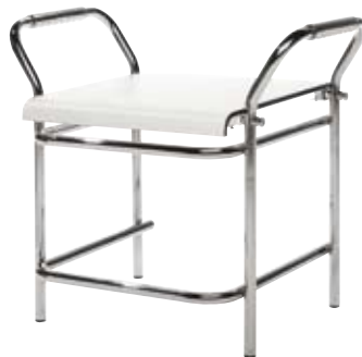
5751 262 00 / 01 Aufstehhilfe (mit abnehmbarer und seitlich einzuhängender HPL-Sitzfläche) / Aufstehhilfe ohne Sitzfläche Supporting seat (with removeable and attachable seat from HPL) / Supporting seat without seat