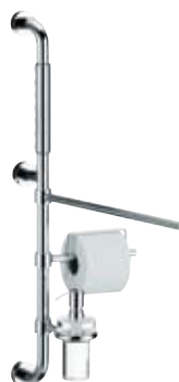
5782 001 00 / 01* / 02** WC-Bidet-Line WC-Bidet-Line