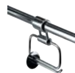
5700 001 03 Papierhalter für Griffe Paper holder for support bar