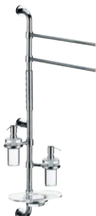
5781 001 00 / 01* / 02** Bidet-Line Bidet-Line