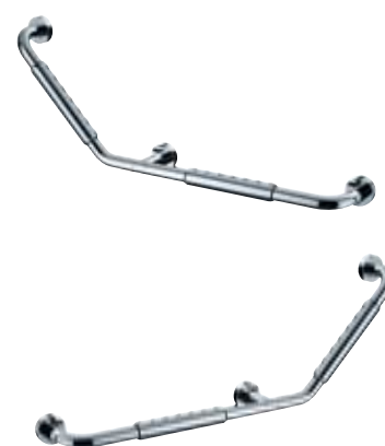
5770 262 70 / 71 Winkelgriff, links/rechts Angle grip, left/right