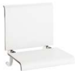
5751 215 01 / 03 Einhängesitz mit HPL-Sitzfläche / mit Kunststoffsitzfläche (nur in Verbindung mit 5751 001 00/01/02) Folding seat, with seat from HPL / with seat from plastic (only available with 5751 001 00/01/02)