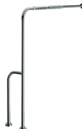
5785 262 86 Boden-Wand--Stützgriff Floor-wall-support bar