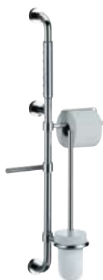
5780 001 00 WC-Line WC-Line