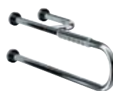
5785 262 61 Stütz-Griff, 600 mm Support bar