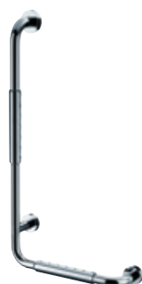
5770 262 61 Winkelgriff, rechts Angle grip, right