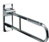
5785 262 60 Klapp-Stütz-Griff, 600 mm Hinged support bar