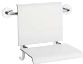
5751 001 02 + 5751 215 02 Kurze Reling für Einhängesitz Short rail for folding seat